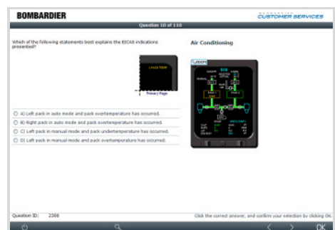
Testfrage in der Benutzerschnittstelle